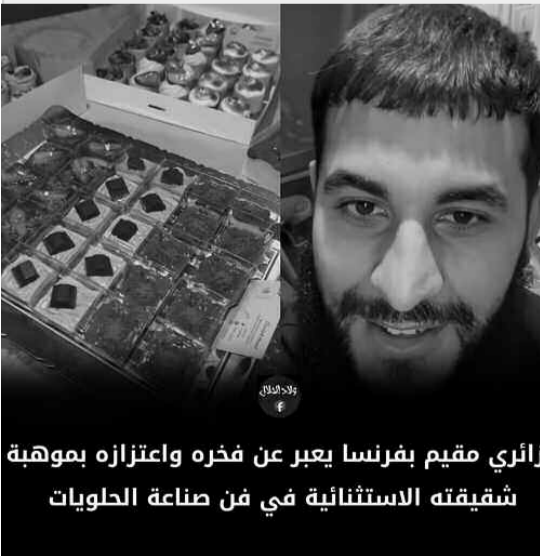
تألبي مقيم بفرنسا يعبر عن فخره واعتزازه بموهبة شقيقته الاستثنائية في فن صناعة الحلويات

في مقطع فيديو عفوي حصد ملايين المشاهدات، ظهر مغترب جزائري مقيم بفرنسا يعبر عن فخره واعتزازه بموهبة شقيقته الاستثنائية في فن صناعة الحلويات، الشاب الذي لم يستطع إخفاء دهشته أمام إبداع أنامل شقيقته، أكد في كلماته الصادقة أن ما تقدمه ليس مجرد "عمل" عابر، بل هو فن، وجه رسالة إلى الجالية الجزائرية المقيمة في مدينة ليون، داعياً للتواصل معه من يحتاج حلويات شقيقته التي حولت الحلويات إلى لوحات فنية، بسبب تلك فيديو أصبح مشروع شقيقته معروف في فرنسا،