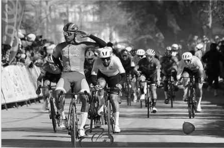
المرحلة السادسة لطواف الجزائر