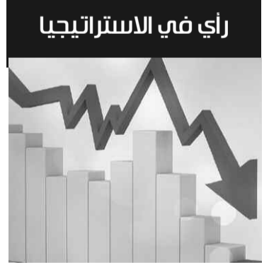
وديع عوادة القدس العربي

بعدما أعلنت الولايات المتحدة عن نيتها معاقبة كتيبة «نيتسح يهودا» بسبب انتهاكاتها لحقوق الفلسطينيين في الأراضي المحتلة، عادت وتراجعت عن ذلك وفق تسريبات إسرائيلية كثيرة. وفيما أعلنت عن قرارها بمعاقبة بعض قادة المستوطنين على الخلفية ذاتها فإنها تزود إسرائيل بمليارات الدولارات ما يبقي الفجوة بين أقوالها وبين أفعالها واسعة.