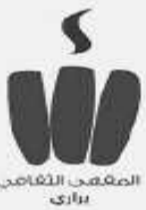
المقهى الثقافي براري

فمجاد و بطولات الشعوب و أهم الأحداث التي عاشتها طيلة سنوات طويلة. لقد كان الشاعر- و ما يزال- شاهداً حقيقياً على فترة مجيدة، عاشها هو الآخر بمشاعره و أحاسيسه ثم ترجمها إلى كلمات و أوزان جميلة. إن هذه المبادرة المتمثلة في تنظيم ملتقى حول الشعر الشعبي بمدينة بسكرة يومي 22 و 23 جانفي 2020، ما هي إلا مناسبة ثمينة من أجل طرح أسئلة- في إطار علمي أكاديمي- حول مدى دقة المعلومات التي يحملها هذا النوع من الأدب، و كيفية مساهمته في الكتابة للتاريخ. س.ت.