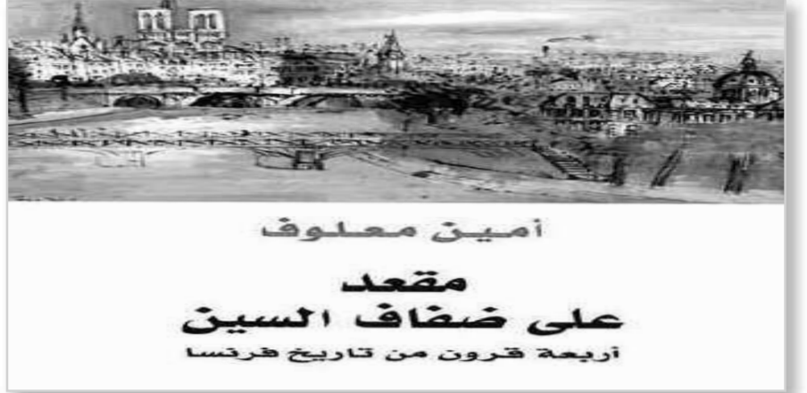
أمين معلوف مقعد على ضفاف السين أربعة قرون من تاريخ فرنسا